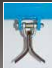
08 Mazza snodata: erba Articulated hammer: grass Martillo articulado: hierba