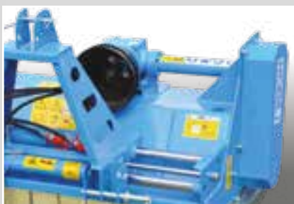
Versión con spostamento idraulico (optional) Version with the hydraulic offset Versión con desplazamiento hidráulico