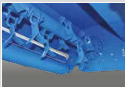
Coltello mobile per erba Swinging knife for grass Cuchilla móvil para hierba