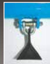
04 PALETTA: erba di parchi e giardini PALLET: grass of parks and gardens PALETA: hierba de parques y jardines