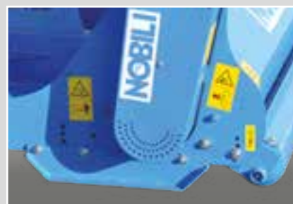
Slitte di appoggio e rullo regolabile di serie Support skids and adjustable roller in standard version Patines de apoyo y rodillo regulable en la versión estándar